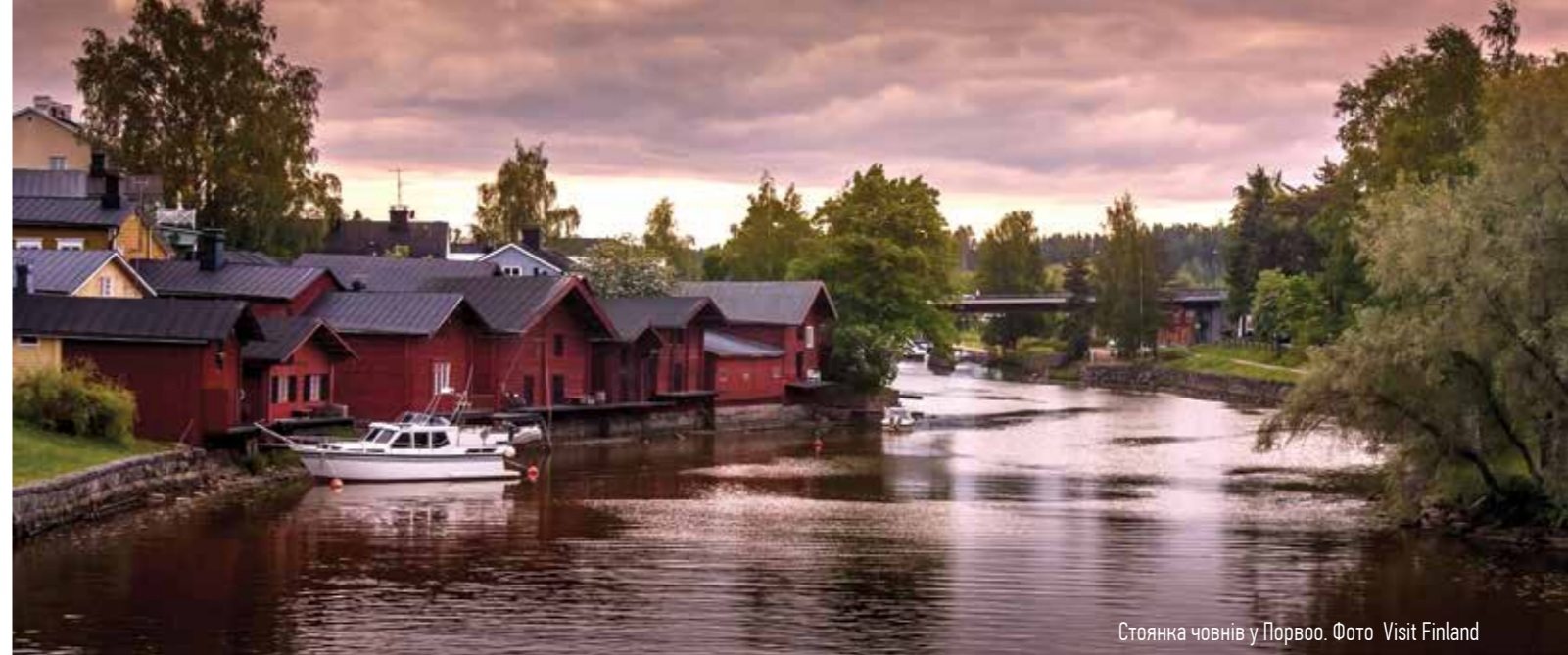
Стоянка човнів у Порвоо.

Для багатьох регіонів Західної та Південної Європи літо 2019 року виявилось надзвичайно спекотним: стовпчик термометра в деяких місцях (наприклад, на морських курортах Іспанії) підіймався до +45 за Цельсієм. Відпочинок у таких умовах сподобається далеко не кожному, тому багато туристів стали шукати регіони з комфортнішим кліматом.