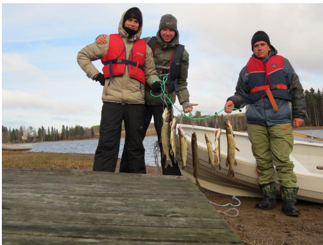
Александр Парфёнов. 2016